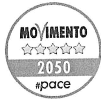
“Movimento 5 stelle”