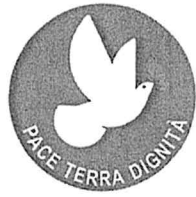
“Pace Terra Dignità”